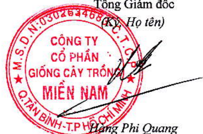
Hàng Phi Quang

3468 CÔNG TY CỔ PHẦN GIỒNG CÂY TRÒN MIỀN NAM Q. TÂN BÌNH - TP. HỒ CHÍ MINH